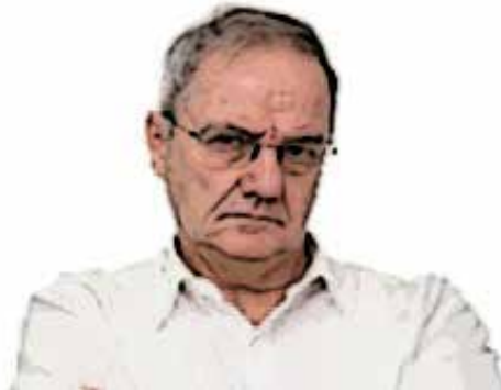
جدول ۵. گفت‌وگو عصبانیت

اخم کردن، برداشتن عینک از روی چشمانم و یا با قفل کردن انگشت‌های دستانم به هم نشان دهم.» از جمله حرکات زبان بدن، که به‌منظور گفت‌وگو عصبانیت به کار برده می‌شود، حرکات ذیل است: ۱. دست‌بردن به موها؛ ۲. اخم کردن؛ ۳. لب‌خند تلخ همراه با برافروختگی چهره؛ ۴. گرفتن پشت گردن با دست؛ ۵. خاراندن گردن یا دور کردن یقه از گردن، و ۶. کنار گذاشتن عینک یا خودکاری که فرد در دهان گذاشته است. مثلاً، مدرسانی که مدت طولانی در یک کلاس درس یا روی صندلی ناراحتی بنشینند از حالت شکل ۵ استفاده می‌کنند. البته در هوای سرد کلاس درس هم این نوع نشستن مشاهده می‌شود. پاهای تاشده همراه با دست‌های تاشده نشان‌دهنده کنار کشیدن و قطع ارتباط با دیگران و ناراحتی است (شکل ۵). همچنین مدرسان شماره ۱، ۴ و ۹ اذعان کردند: «در برخی مواقع دانشجویانم سر کلاس درس با همدیگر به‌طور متوالی و بسیار زیادی و دوبه‌دو با هم حرف می‌زنند؛ بنابراین، برای اینکه بفهمند از دستشان ناراحت شدم دست را پشت گردنم می‌برم و آن را می‌خارانم.» مصاحبه‌شونده شماره ۲ اظهار داشت: «برخی مواقع بعضی از دانشجویان بهموقع سر کلاس نمی‌آیند یا دیر می‌رسند. زمانی که وارد کلاس می‌شوند سرم را به نشانه ناراحتی از آن‌ها به سمت راست و چپ تکان می‌دهم. در برخی موارد به‌جای این کار تا چند دقیقه روی صندلی خود دست‌به‌سینه می‌نشینم.»