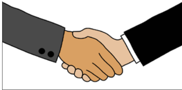
جدول ۳. گفتمان صمیمیت

دیگر، دست‌دانی که کف دست به چپ یا راست باشد (برابری و تسلط‌نداشتن) استفاده می‌کنند. مثلاً، مدرس شماره ۱ و ۵ اظهار داشتند: «وقتی دانشجویان درباره موضوعی شروع به صحبت می‌کنند، بیشتر نگاه خود را با دقت به سمت آن‌ها می‌برند و با حرکت سر و توجه به صحبت‌هایشان رابطه صمیمی را میان خود و دانشجو افزایش می‌دهند.» مصاحبه‌شونده ۳، ۷ و ۹ بیان کردند: «در برخی مواقع، در اواسط زنگ، بین دانشجویان می‌روم و با دستی روی شانه‌های آن‌ها و گرفتن بازویشان با آن‌ها رابطه صمیمی بیشتری برقرار می‌کنم.» شرکت‌کننده‌های ۱۱ و ۱۳ اظهار داشتند: «هنگامی که دانشجویان داستان یا حکایتی جالب و شوخ را در ارتباط با موضوع تدریس در کلاس درس مطرح می‌کنند، با بالابردن ابرو و لبخند و با نگاه کردن با گوشه چشم به او، به نوعی ضمن تشکر از او، بینمان ارتباط صمیمانه‌تری برقرار می‌کنم.» همچنین آن‌ها بیان کردند: «هنگام ورود به کلاس درس با آن‌ها با دو دست و محکم دست می‌دهند تا موجب افزایش این صمیمیت شوند.» مصاحبه‌شونده شماره ۳ نیز اذعان داشت: «هنگامی که در مورد مبحث یا محتوای موضوعی صحبت می‌کنم، بیش از دوسوم وقت صحبت کردن را چشم در چشم با مردمک باز به دانشجویان نگاه می‌کنم.»