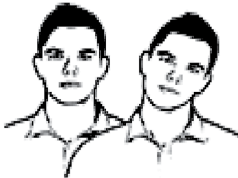
شکل ۷. گفتمان کنترل

دستم را روی میز بکوبم، از پاهایم استفاده می‌کنم. نخست آرام‌آرام و سپس تندتر پایم را بر زمین می‌کوبم.» همچنین او بیان کرد: «در برخی مواقع با حرکت دست به سمت پایین به دانشجویانم القا می‌کنم که روی صندلی‌های خود بنشینند.» مصاحبه‌شونده شماره ۸ اظهار داشت: «وقتی دانشجویان بسیار زیاد شلوغ می‌کنند و صدایشان بلند است برای اینکه کنترل شوند و صدایشان پایین آید از دستم استفاده می‌کنم؛ [نشان میدهد] به این صورت دستم را بالا و پایین می‌کنم. این کار باعث می‌شود صدای آن‌ها کم شود.»