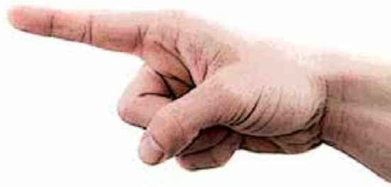
شکل ۱. گفتمان هشدار

یکی از مقوله‌هایی که تمامی مصاحبه‌کنندگان به آن اشاره داشته‌اند گفتمان هشدار در جریان کلاس درس است. حرکات در این گفتمان عمدتاً پیامی بیمناک دارند. بسیاری از این حرکات با «خشم» و «خطر» همراه‌اند. در این باره مدرس شماره ۳ می‌گوید: «هنگامی که می‌خواهم دانشجویانم را از خطر نمره در اواخر ترم آگاه کنم، از انگشت اشاره و تکاندادن آن توأمان با سخن استفاده می‌کنم.» شرکت‌کننده شماره ۷ در این مورد اظهار می‌دارد: «وقتی که دانشجویانم درس تدریس‌شده هفته گذشته را مطالعه نکرده‌اند برای اینکه بفهمند از کارشان خشمگین شده‌ام لب‌هایم را می‌جوم و بیش از حد چشمانم را باز می‌کنم.» همچنین مصاحبه‌شونده شماره ۱۱ بیان می‌کند: «در برخی از کلاس‌ها که از دانشجویها شیطنت‌های کوچکی می‌بینم یا اینکه کنار دستی خود را اذیت می‌کنند دستم را به نشانه هشدار پشت گردنم می‌گذارم و سرم را به این طرف و آن طرف (چپ و راست) تکان می‌دهم و با نگاهی کوتاه به آن می‌فهمانم که از حرکت آن‌ها خشمگین شدم.» خشم با نگاه محکم و ثابت به منبع رنجش، اخم یا ترش‌رویی و به‌هم‌فشردن دندان‌ها مشخص می‌شود. برخی افراد در هنگام خشم رنگشان می‌پرد، اما عده‌ای دیگر در خشم شدید، قرمز و حتی مایل به ارغوانی می‌شوند. مدرسان برای نشان دادن خشم خود، در مراتبی گوناگون، با دیگران ارتباط غیر کلامی برقرار می‌کنند و آن‌ها را از میزان خشم خود آگاه می‌سازند (شکل ۱).