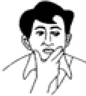
شکل ۶. گفتمان تفکر

روی بینی خود می‌گذارم و درمورد سؤال فکر می‌کنم.» مدرس شماره ۵ می‌گوید: «قبل از اینکه بخواهم از دانشجویانم بپرسم که هفته قبل چه مبحث یا موضوعی را تدریس کردم ابروهایم را بالا می‌برم و سرم را می‌خارانم و به جایی خیره می‌شوم. به‌علاوه، در برخی اوقات که دانشجویانم از من سؤال می‌پرسند با همین حرکت در چند ثانیه بعد به آن‌ها پاسخ می‌دهم.» مصاحبه‌شونده شماره ۸ اظهار داشت: «هنگامی که می‌خواهم درمورد تکلیف جلسه آتی دانشجویان فکر کنم دست خود را زیر سرم می‌گذارم و درمورد مرور تکالیف جلسه قبل و جلسه آینده فکر می‌کنم. مدرس شماره ۱ اذعان داشت: «هنگامی که دانشجویی سؤالی می‌پرسد، قبل از اینکه پاسخ نهایی را بدهم، دست در ریش خود می‌برم و آن را می‌خارانم و به آن سؤال فکر می‌کنم.»