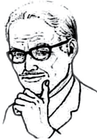
شکل ۲. گفتمان تأیید و عدم تأیید

تکاندادن سر و دست به وضوح داشتن یا نداشتن توافق را بدون نیاز به کلمات منتقل می‌کند. مثلاً، تکاندادن سر به دو شکل عمودی و افقی صورت می‌گیرد که حرکت سر مدرسان به سمت افقی به معنای تأییدنکردن مطالب فراگیران است و حرکت سر در جهت عمودی نشان‌دهنده توافق مدرسان با صحبت‌های فراگیر است. اکمن و استر ۳۷ (۱۹۷۹) معتقدند ما با کجکردن سر علاقه‌مندی خود را به حرف‌های طرف مقابل ابراز می‌کنیم. علاوه‌براین، با تکان‌های سر تمایلمان را به ادامه صحبت نشان می‌دهیم و مدرسان نیز از همین روش برای تشویق فراگیران به صحبت استفاده می‌کنند. از جمله حرکاتی که به منظور گفتمان تأییدی استفاده می‌شوند عبارت‌اند از: پایین‌آوردن سر، پایین‌آوردن چانه و جلو آوردن سر، نزدیک‌شدن به مخاطب، کفزدن (تند)؛ و در گفتمان عدم تأییدی به حرکاتی از جمله دور شدن از مخاطب، نگهداشتن سر به سمت پایین، بالابردن چانه و عقب‌بردن سر و بالابردن سر میتوان اشاره کرد.