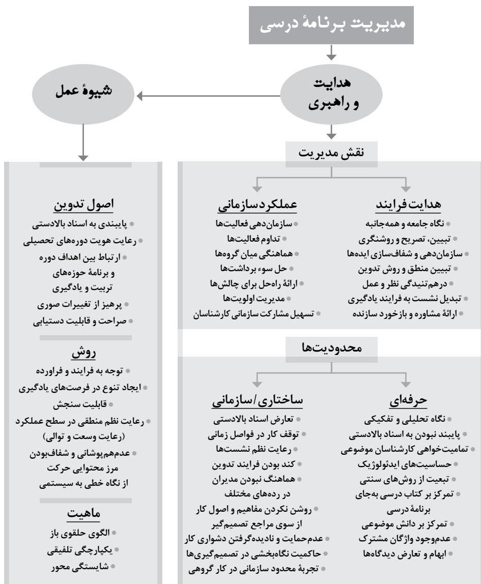
نمودار ۱. مضمون اصلی، مقوله‌ها و کدهای محوری

وجود خاستگاهی مشترک در زمینه روش‌شناسی صورت‌بندی اهداف و برنامه درسی، حوزه‌های تربیت و یادگیری بیشترین تأثیر را برای کاهش فاصله میان برنامه درسی قصدشده (مرحله تدوین و تصویب) با برنامه درسی آرمانی داشته است و از این نظر می‌توان عملکرد مدیریت را در سطح نهادی در فرایند برنامه‌ریزی درسی تأثیرگذار دانست. اما آنچه موجب فاصله برنامه درسی قصدشده با برنامه درسی آرمانی در مرحله تدوین