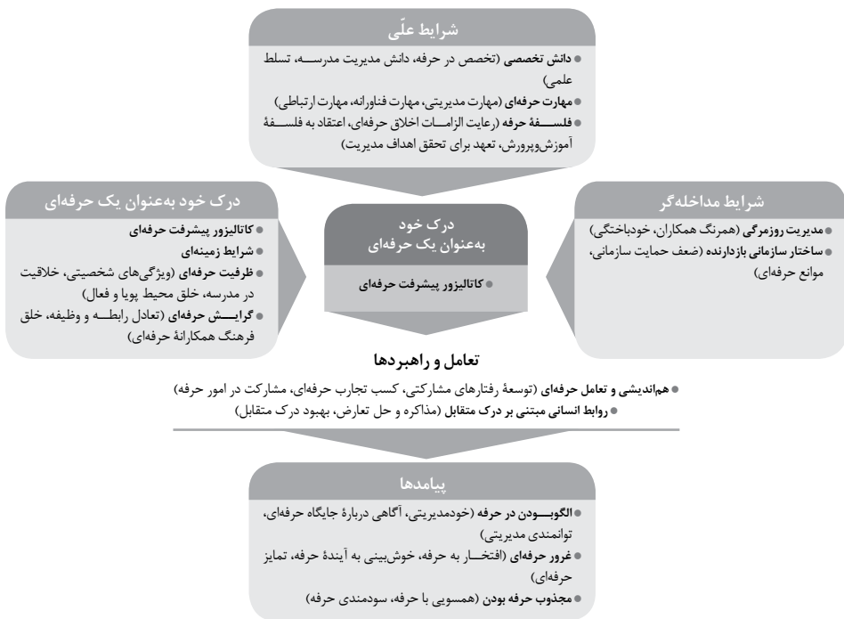
شکل ۲. مدل پارادایمیک: هویت حرفه‌ای مدیر مدرسه به‌مثابهٔ درک خود به‌عنوان یک حرفه‌ای: کاتالیزور پیشرفت حرفه‌ای

در مدل پارادایمیک پژوهش (شکل ۲)، کنشگران درگیر در هویت حرفه‌ای مدیر مدرسه این پدیده را به‌مثابهٔ «درک خود به‌عنوان یک حرفه‌ای: کاتالیزور پیشرفت حرفه‌ای» درک و حس می‌کنند.