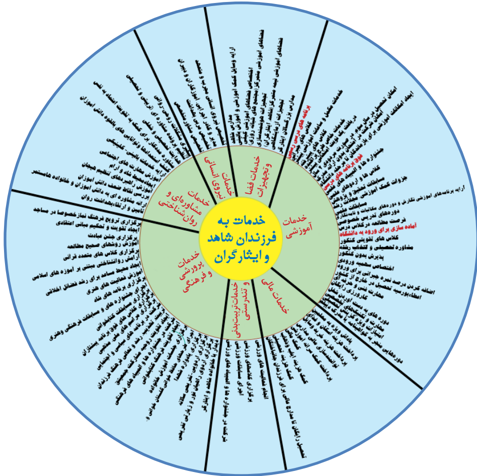
شکل ۱. الگوی اولیه ارائه خدمات آموزشی و پرورشی به فرزندان دانش‌آموز شهیدا و جانبازان و ایثارگران در ایران

تدوین الگوی ارائه خدمات آموزشی و پرورشی به فرزندان دانش‌آموز شهیدا و جانبازان و ایثارگران در ایران