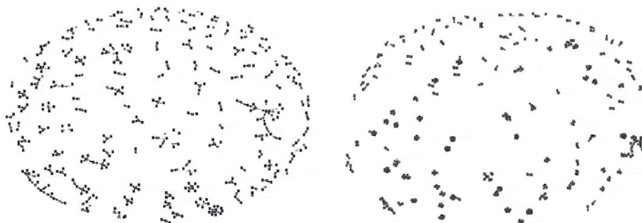
نمودارهای ۲ و ۳ مشاهده تعداد دو نویسنده و بیشتر

نمودارهای ۲ و ۳ نشان می‌دهد بیشتر مقاله‌های این مجله، به صورت انفرادی یا دو نویسنده‌ای نوشته شده‌اند و این باعث شده که ارتباط منسجمی بین آن‌ها ایجاد نشود. نمودار ترسیم‌شده، انسجام پایینی دارد.