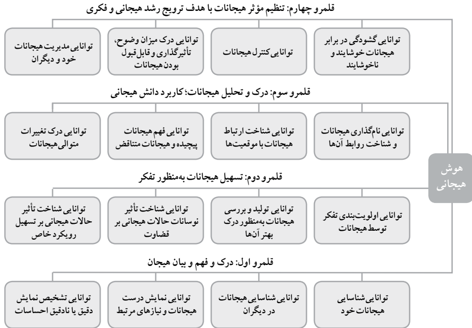
شکل ۱. قلمروهای هوش هیجانی: منبع: مایر و سالوی، ۱۹۹۷ (با تلخیص)

در ادامه، آن دسته از فعالیت‌های اجتماع پژوهشی که در ارتباط با ابعاد سه‌گانه تفکر مراقبتی انجام می‌شوند مورد بررسی قرار می‌گیرند و روشن می‌شود که هر فعالیت، مربوط به کدام نوع یا انواع تفکر مراقبتی است و با کدام توانایی یا توانایی‌های مربوط به هوش هیجانی ارتباط دارد.