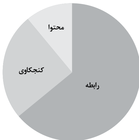
نمودار شماره ۱. ارتباط موجود بین سه عنصر محتوا، کنجکاوی و رابطه

همچنین در بیشتر منابع اصلی مرتبط با کلاس معکوس، از جمله آثار برگمن و سمس، الگوی یادگیری معکوس، به وارونه کردن طبقه‌بندی بلوم ۳۱ و هرم معکوس بلوم مرتبط می‌شود. طبقه‌بندی بلوم یکی از شناخته‌شده‌ترین چارچوب‌های نظری درباره توصیف نحوه یادگیری افراد در سراسر جهان است. برگمن و سمس (۲۰۱۴)، سه عنصر اساسی آموزش را شامل محتوا ۳۲ ، کنجکاوی ۳۳ و رابطه ۳۴ معرفی و وضعیت فعلی آموزش در بیشتر مناطق جهان را این‌گونه توصیف می‌کنند: