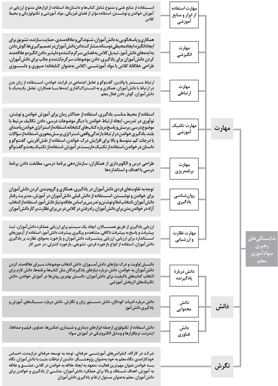
شکل ۲. چارچوب شایستگی‌های رهبری سوادآموزی معلم