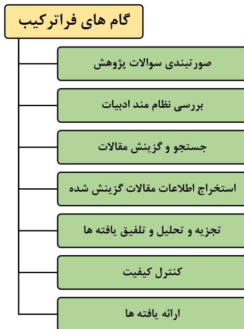
شکل ۱. مراحل فراترکیب (سندولوسکی و همکاران، ۲۰۰۷)

۱. صورتبندی سوال پژوهش: این مطالعه به این پرسش اساسی پاسخ می‌دهد که "شایستگی‌های به‌کارگیری هوش مصنوعی معلمان از چه مولفه‌هایی تشکیل شده است؟" ۲. بررسی نظام‌مند ادبیات: جامعه پژوهش، کلیه اسناد علمی - پژوهشی منتشر شده در پایگاه‌های داخلی و خارجی بین سال‌های ۲۰۲۰ تا آوریل ۲۰۲۵ را که به شایستگی‌های هوش مصنوعی معلمان پرداخته است، در بر می‌گیرد. واژگان کلیدی و استراتژی‌های جست‌وجو در پایگاه‌های اطلاعاتی شامل سیج ۶۶ ، پاب‌مد ۶۷ ، ریسرچ‌گیت ۶۸ ، گوگل‌اسکولار ۶۹ ، ساینس‌دایرکت ۷۰ ، ایمرالد ۷۱ ، اشپرینگر ۷۲ ، پروکوئست ۷۳ ، ایران‌داک ۷۴ ، اس‌آی‌دی ۷۵ ، نورمگز ۷۶ و مگ‌ایران ۷۷ در جدول ۱ ارائه شده‌اند.