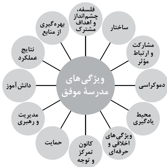
شکل ۱. ویژگی‌های مدارس موفق طبق یافته‌های کشورهای شرکت کننده در ISSPP

مدرسه موفق، مدیر موفق مطالعه تطبیقی یافته‌های پروژه بین‌المللی مدیر مدرسه موفق (ISSPP)